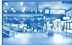
Südlichen Ausgang des Hbf benutzen

Vom Hauptbahnhof gehen Sie durch den südlichen Ausgang Neustadt , immer geradeaus Richtung Ückendorf, (ca. 10 Min.)