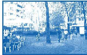
Sie passieren Neustadtplatz mit Brunnen