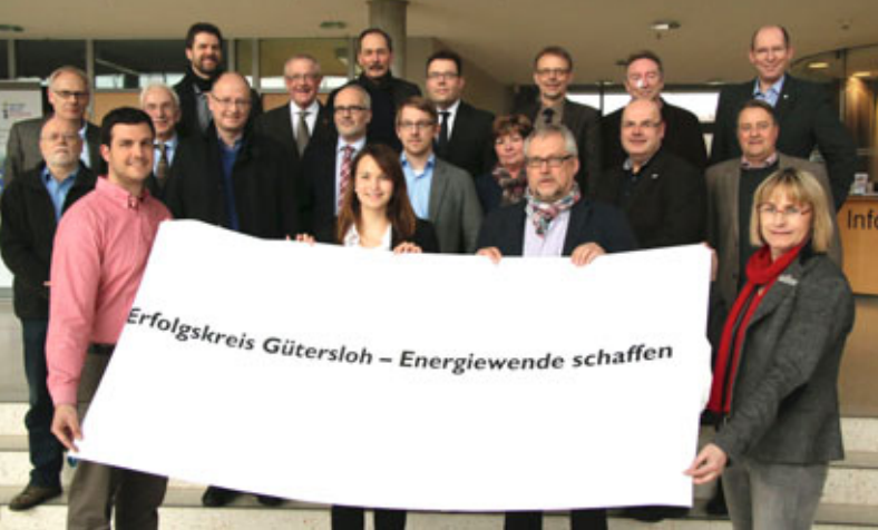
Die Lenkungsgruppe des Integrierten Klimaschutzkonzeptes des Kreises Gütersloh.