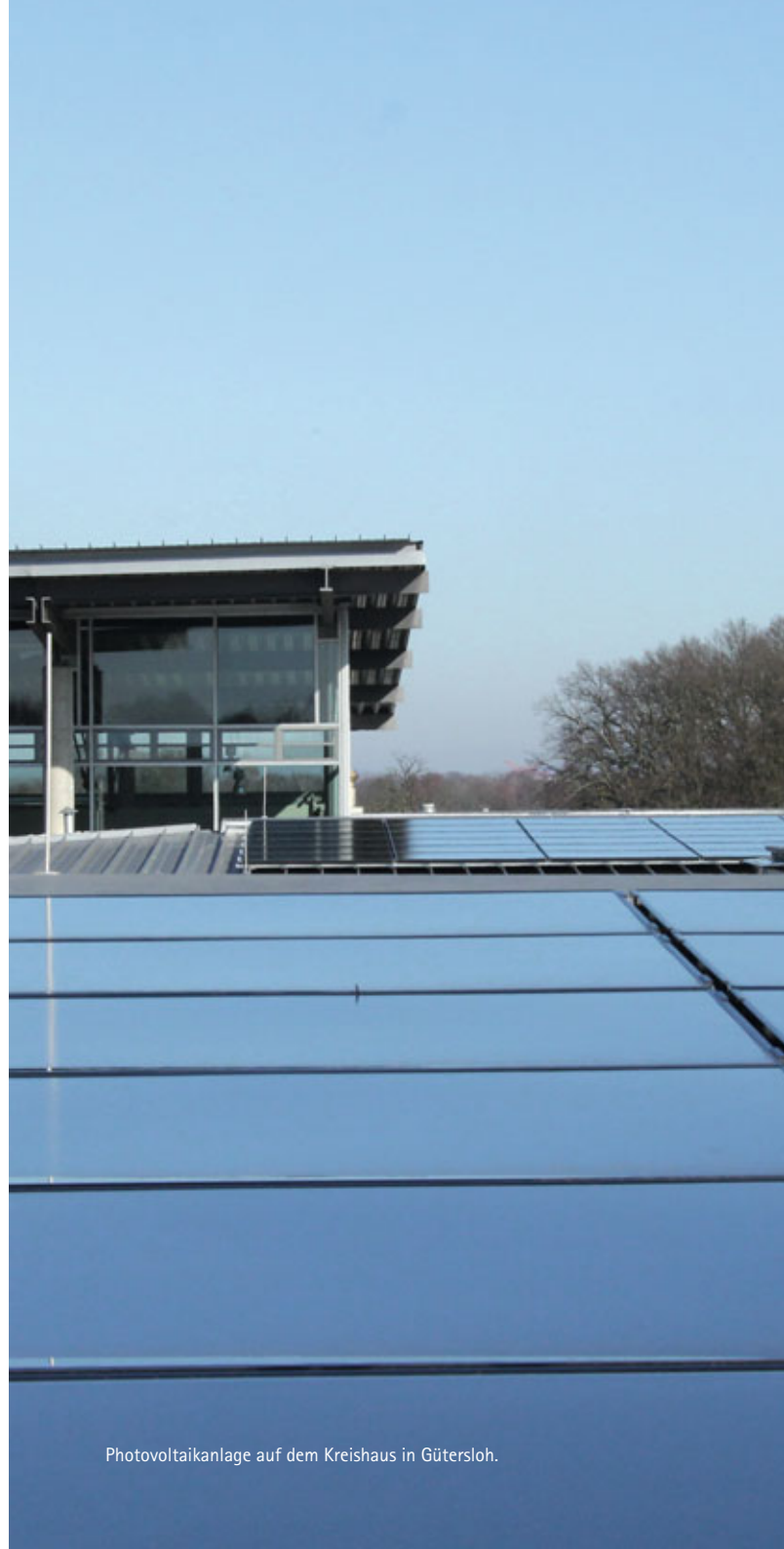
Photovoltaikanlage auf dem Kreishaus in Gütersloh.