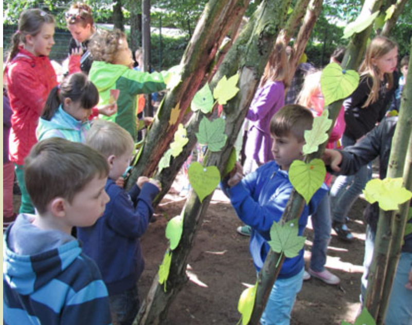
Kleine Klimaschützer der Marienschule in Harsewinkel formulieren ihre Wünsche zum Klimaschutz.

Die Themenwochen finden im Rahmen des Integrierten Klimaschutzkonzeptes des Kreises Gütersloh statt und werden von der Koordinierungsstelle Energie und Klima des Kreises koordiniert.